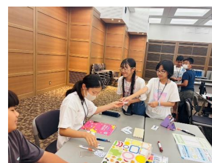
応援したい企業に投資（水戸証券）