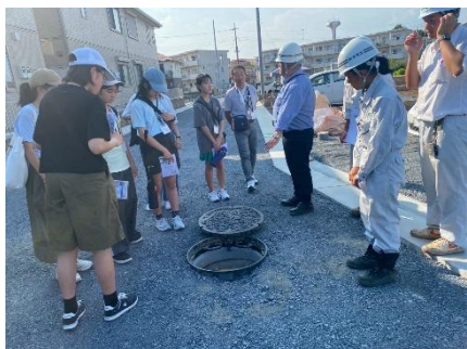
マンホールの中を見学（要建設）