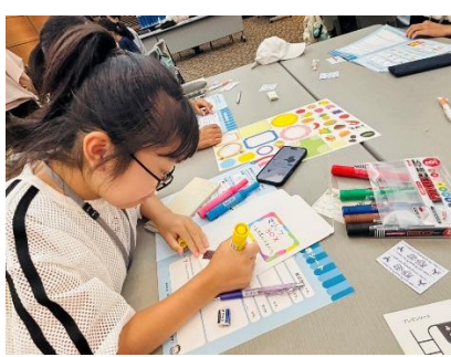
新商品開発体験（水戸証券）