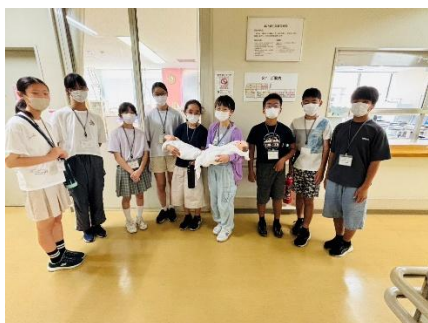
新生児を見学（水戸済生会総合病） ※新生児の人形を抱えています。