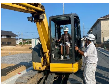
重機乗車体験（要建設）