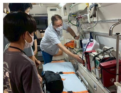
ドクターカー見学（済生会総合病院）