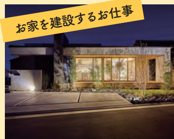
お家を建設するお仕事

1台のクルマが完成するまでの工程や、たくさんの部品をお届けする様子を実際に見て、触れて、お話を聞いて、一緒に学びましょう！