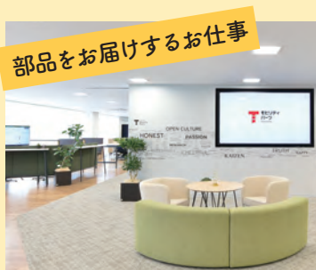
部品をお届けするお仕事

実際の生産工場に入って、もやしができる様子、そしてもやしを生産している職人たちの想いをお話いたします。