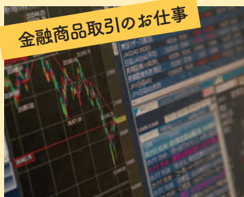
金融商品取引のお仕事

ノーブルホームは茨城県内で8年連続、一番多くの家を建築しており、茨城だけではなく、日本の皆さんの暮らしを更に便利に・快適にできるよう、日々努めています。今回はノーブルビレッジ水戸笠原にある家を2棟ご案内させていただきます。