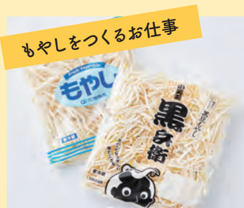
もやしをつくるお仕事